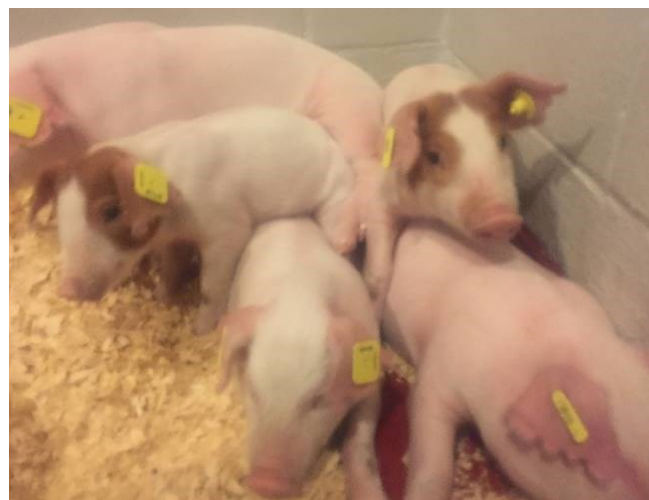
Porcelets en isolement.

Dans cette optique, l'objectif principal de ce projet est de développer et de tester des produits, qui seraient ajoutés aux rations, pour rempla-