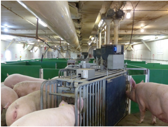
Truies à la ferme Hog Tied Farms.

variables sont modifiées – l'équipe a évalué la variation des prix du maïs et du tourteau de soya pendant une période de cinq ans. Encore une fois, l'alimentation multiphase par parité est sortie gagnante, permettant de faire des économies annuelles de 1,66 $ à 10,06 $ par truie comparativement à l'alimentation conventionnelle.