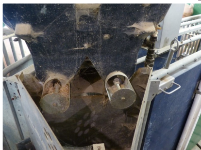
L'installation d'une 2e ligne d'alimentation à la ferme Hog Tied Farms a permis d'utiliser simultanément deux types de rations.

Bien sûr, si vous connaissez le moindrement le secteur porcin, vous savez que le prix des aliments est susceptible d'être affecté par d'importantes fluctuations au fil du temps. En utilisant une analyse de sensibilité – un modèle financier permettant de déterminer comment les variables d'intérêt sont affectées lorsque d'autres